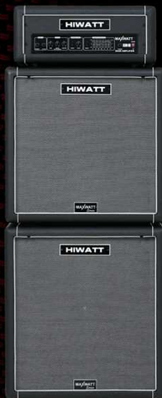
B300-HD 300 Watt Bass Head & B115 (1x15") Cabinet B410 (4x10") Cabinet

Visit www.hiwatt.co.uk for more details.