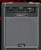
B20 20 Watt Bass Combo