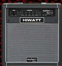
B60 60 Watt Bass Combo