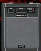
B20 20 Watt Bass Combo