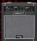
B15 15 Watt Bass Combo