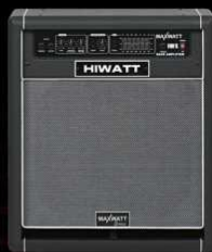
B100 100 Watt Bass Combo