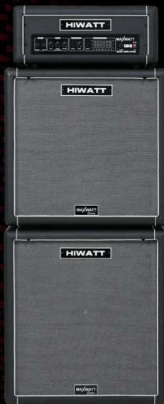
B300-HD 300 Watt Bass Head & B115 (1x15") Cabinet B410 (4x10") Cabinet

Visit www.hiwatt.co.uk for more details.