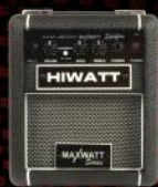
Spitfire 10 Watt Guitar Combo