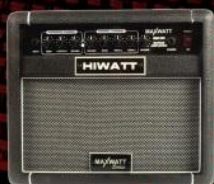
G20 20 Watt Guitar Combo