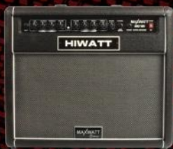
G50 50 Watt Guitar Combo