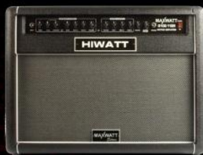
G100 100 Watt Guitar Combo