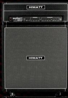
G200-HD 200 Watt Guitar Head & M412 (4x12") Cabinet

Visit www.hiwatt.co.uk for more details.