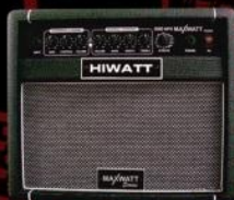
G20-AFX 20 Watt Guitar Combo with Effects